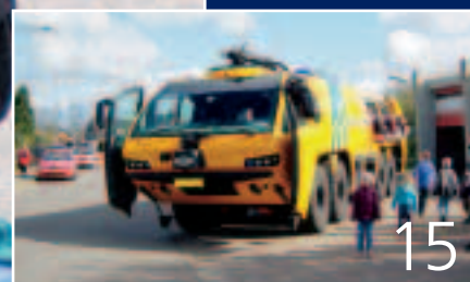
Open dag Sevenum