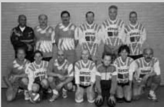
21 mei 2005 - NK Volleybal te Haarlem